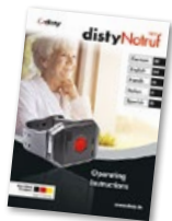
Bedienungsanleitung Operating instructions Mode d'emploi Manuale di istruzioni Manual de instrucciones